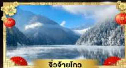
จี๋จ้ายโกว