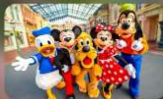
ดิสนีย์อีสรุ