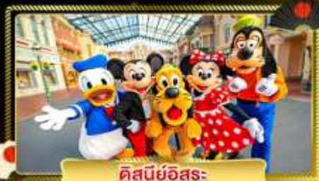
ดิสนีย์อิสระ