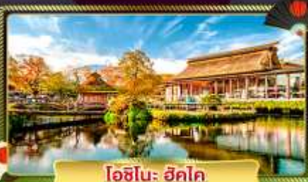
ไอชิโนะ ฮัตโค

ขึ้นกระเช้าลอยฟ้าฮาโกเนะ ชมวิวทะเลสาบอะชิโนะโทะ