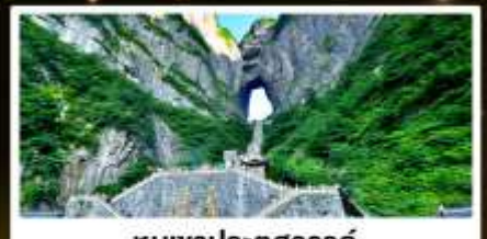
ทิวเขาประตูสวรรค์