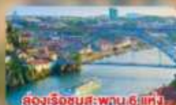
ล่องเรือชมสะพาน 6 แห่ง ในคูร์เมืองปอร์โต