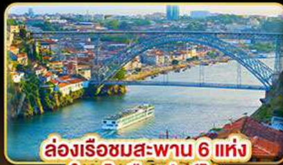
ล่องเรือชมสะพาน 6 แห่ง ในคูโรเมืองปอร์โต