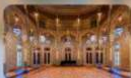
Palacio the Bolsa