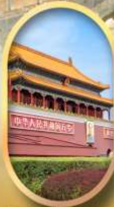
จัสมุรีเทียนอันเหมิน