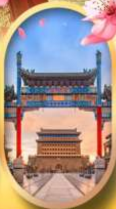
ถนนคนเดินเจียมเหมิน