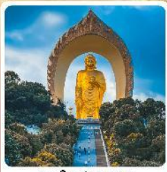
พระใหญ่ตงหลิน