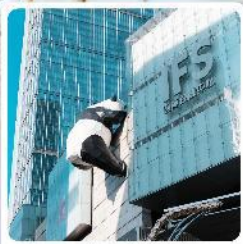
IFS ตึกหมีแพนด้า

● ไอโกล์ นั่งกระเช้าขึ้นชมภูเขาหิมะว้าวู๋ ซื้อมั้กถนนชุนซีลู่ แลนด์มาร์คแพนด้ายักษ์เป็นตึก IFS เจียงตู