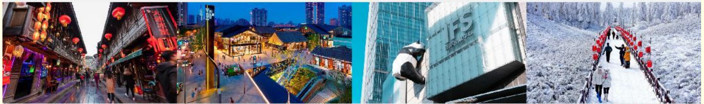
ถนนโบราณจิ้นหลี่