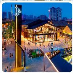
ถนนคนเดินไท่กุ๋หลี่