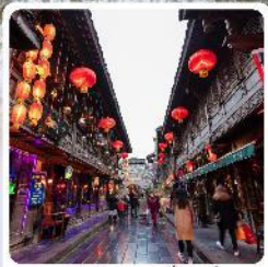
ถนนโบราณจีนหลี่