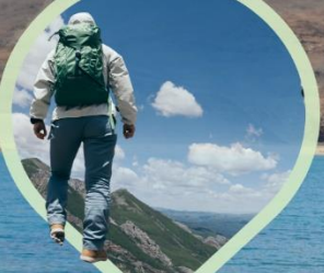
สวยสะกดทุกวิว ไปให้เห็นด้วยตา แล้วใช้ใจ...จดจำ