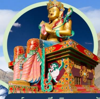
องค์พระศรีอริยเมตตรัย