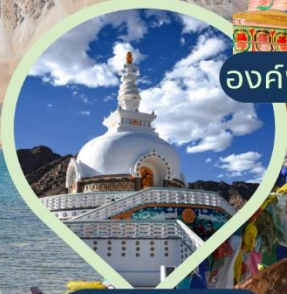
เจดีย์สันติภาพ