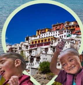
วัดธิเบตนิคายมหายาน หมวกแดง หมวกเหลือง