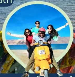
ทะเลสาบน้ำเค็มสูงที่สุดในโลก แปงกอง