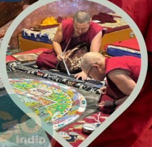
พระลามะ ผู้มีวัตรปฏิบัติ อันอัศจรรย์