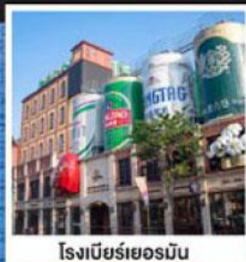
โรงเบียร์เยอรมัน