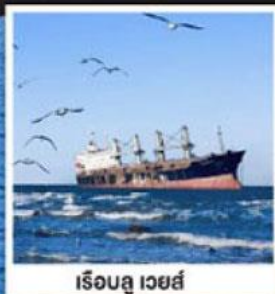
เรือลู เวยส์