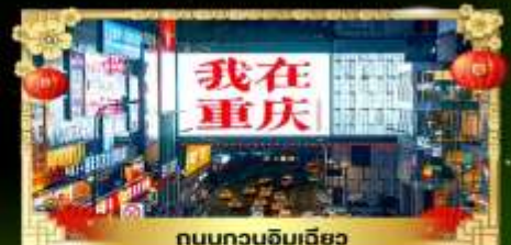
ถนนทวงฉิมเฉียว