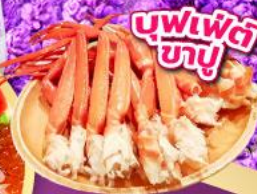
บุฟเฟ่ต์ ซาซุ