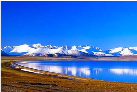
ทะเลสาบชิงไห่ใหญ่

เช้า รับประทานอาหารเช้า ณ ห้องอาหารของโรงแรม (1) หลังอาหารเช้าท่านเดินทางโดยรถบัสสู่ ทะเลสาบชิงไห่ใหญ่ (ระยะทาง 150 กม.ใช้เวลาเดินทางราว 2 ชั่วโมงเศษ)