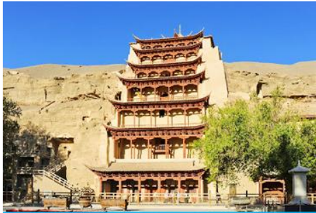
ถ้ำหินมั่วเกาถู

เช้า รับประทานอาหารเช้า ณ ห้องอาหารของโรงแรม (9)