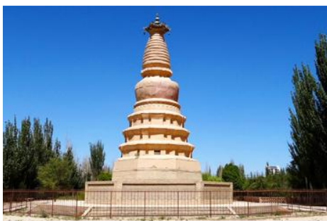
เจดีย์ม้าขาว

เที่ยง รับประทานอาหารกลางวัน ณ ภัตตาคาร (10)