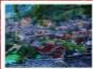
หมู่บ้านแม่วชิเจียง