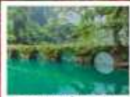
อุทยานเสี่ยวซีโขง