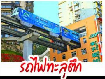
รถไฟทะลุติ๊ก