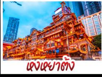
ตงเฉยตัง