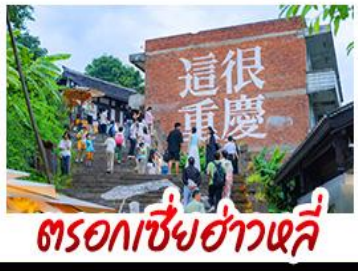
ตรอกเซี่ยฮ่าวหลี่