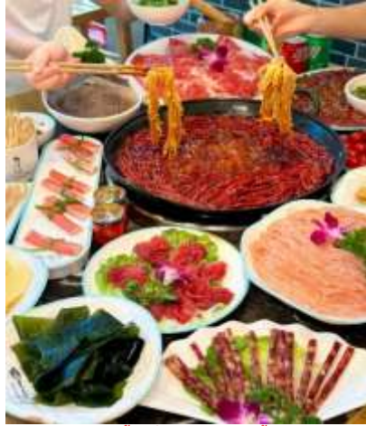
*ภาพนี้ใช้เพื่อการโฆษณาเท่านั้น*