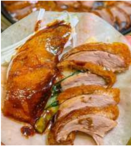
*ภาพนี้ใช้เพื่อการโฆษณาเท่านั้น*