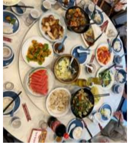
*ภาพนี้ใช้เพื่อการโฆษณาเท่านั้น*