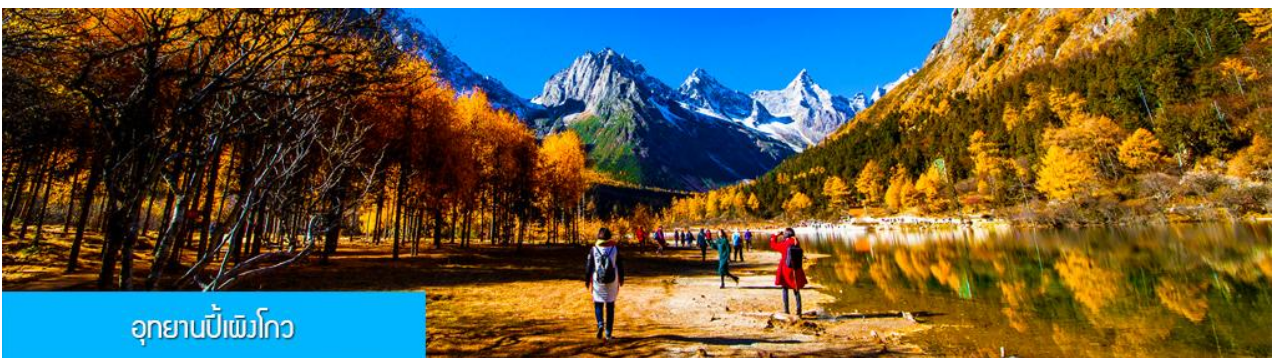
อุทยานเป่ย์เฟิงโกว