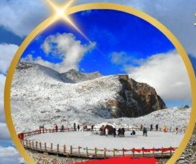
OPTIONAL TOUR ชารน้ำแข็งต้ากู่ปิงชวน