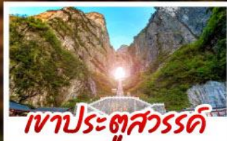
เขาประตูลั่วสวรรค์