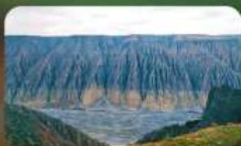
แกรนด์แคนยอนคูซานจื่อ