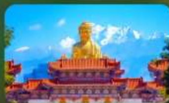
วัดพระใหญ่หรงกวงซาน