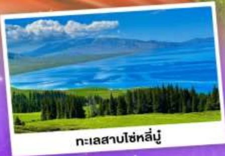
ทะเลสาบไซหลี่มู่

เที่ยวทุ่งหญ้าคอกฟ้า นาราตี ชมความสวยงามทะเลสาบไซหลี่มู่