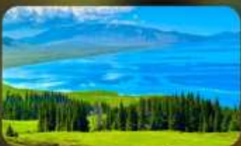
ทะเลสาบโซหลี่มู่