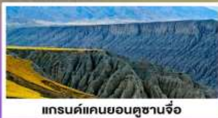
แกรนด์แคนยอนตูซานจื่อ