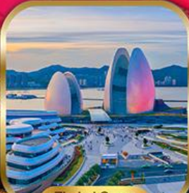
Zhuhai Opera House