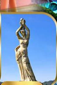
จูไห่ฟิชเชอร์รี่