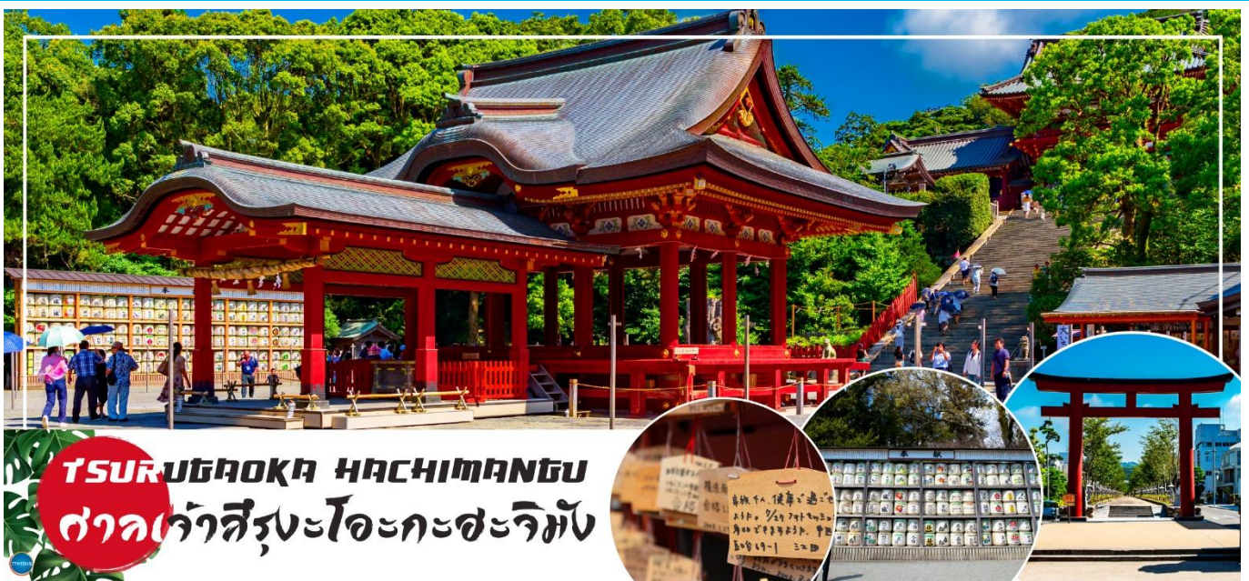
TSURUGAOKA HACHIMANGU ศาลเจ้าสิริงะโอะกะสะจิมัง

วันที่สอง ท่าอากาศยานนานาชาติ นาริตะ – เมืองคามาคุระ – ศาลเจ้าสิริงะโอะกะ สะจิมัง – ถนนโคมาจิโดริ – เกะเอโนชิมะ – ศาลเจ้าเอโนชิมะ – ถนนเบ็นไซเท็นนากามิสะ – เมืองยามานาชิ – ออนเซ็น