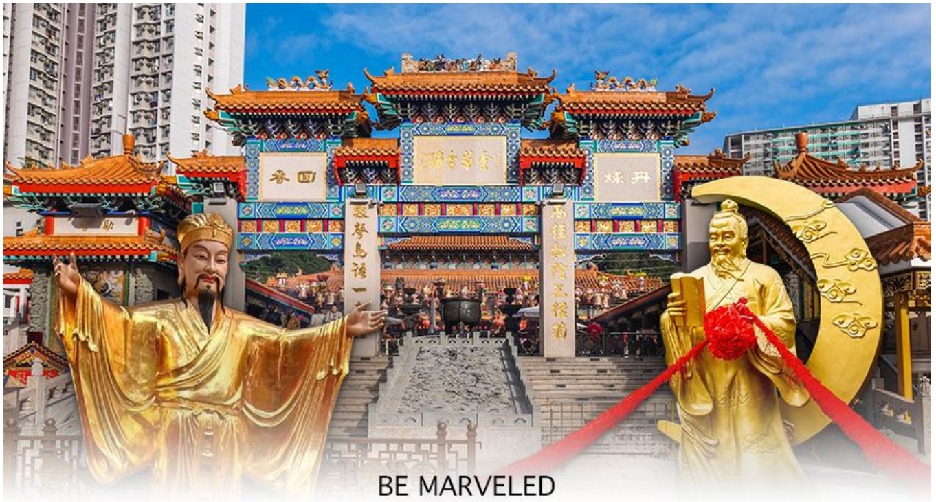
BE MARVELED วัดหวังต้าเซียน

พระหวังต้าเซียน หรือที่รู้จักกันในชื่อ ฮวงชูปิง (Huang Chu-ping) ในช่วงประมาณศตวรรษที่ 4 ได้เดินทางจากเมืองจินมาเผยแผ่ ศาสนาในฮ่องกง และสร้างวัดแห่งนี้ขึ้นมาเมื่อประมาณปีค.ศ. 1921 ค่ะ ภายในวัดจะมีทั้ง เทพเจ้าหวังต้าเซียน, เจ้าแม่กวนอิม, เจ้า ที่, เทพเจ้าหยุกโหลว (เทพเจ้าแห่งความรัก), ท่านขงจื้อ ซึ่งคนฮ่องกงเอง และนักท่องเที่ยวก็จะมาราบไหว้เพื่อสิริมงคล กัน โดยเฉพาะอย่างยิ่งคือ เทพเจ้าหยุกโหลว หรือ เทพเจ้าแห่งความรัก ที่เราเรียกกันว่า เทพเจ้าด้ายแดง เป็นพิภักดิ์ที่หลายๆ คน มักจะไปขอความรักจากท่านกัน นอกจากนี้ที่เราจะต้องเอาด้ายแดงมาพันมือนี่ ตามป้ายที่แนะนำข้างหน้าแล้ว ไกด์นำเที่ยวคน ฮ่องกงบอกมาว่าถ้าเป็นผู้หญิงอย่างเราอยากได้แฟน ก็ต้องไปผูกด้ายที่รูปปั้นผู้ชายและพอไหว้เสร็จแล้วก็อย่าลืมหยอดทำบุญใส่ตู้ ไปด้วย