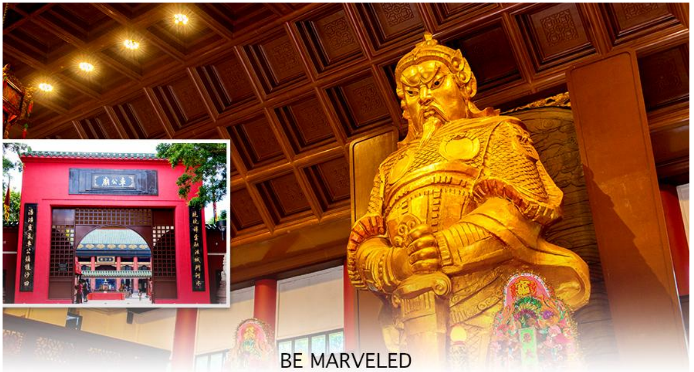
BE MARVELED วัดแชกง

นำท่านเดินทางสู่ วัดแชกงหมิว หรืออีกชื่อหนึ่งว่า “ วัดกังหันลม ” โดยมีสัญลักษณ์เป็นกังหันนำโชค สร้างขึ้นเพื่อรำลึกถึงท่านแชกงองค์เก่าแก่ มีอายุกว่า 300 ปี ตั้งอยู่ในเขต SHATIN ให้ท่านได้จุดธูปขอพร สักการะ เทพเจ้า แชกง เป็นอีกหนึ่งวัดที่มีประวัติศาสตร์อันยาวนาน มีตามตำนานเล่ากันว่าได้มีโจรสลัดต้องการที่จะมาปล้นชาวบ้าน เมื่อนายพลแชงรู้เข้าก็ได้บอกให้ชาวบ้านปักกังหันลมแล้วนำไปติดไว้ที่หน้าบ้าน ปรากฏว่าโจรสลัดได้จากไปและไม่ได้ ทำการปล้น ชาวบ้านจึงมีความเชื่อว่ากังหันลมนั้นช่วยขจัดสิ่งชั่วร้ายที่กำลังจะเข้ามา และนำพาสิ่งดีๆ มาสู่ตน จึงได้ สร้างวัดแชกงแห่งนี้ขึ้น เพื่อระลึกถึงนายพลแชง และเป็นที่สักการะบูชาเพื่อไม่ให้มีสิ่งไม่ดีเกิดขึ้น โดยจะมีวิธีการไหว้ คือ ตั้งจิตอธิษฐานด้านหน้าองค์เจ้าพ่อแชง จากนั้นให้ท่านหมุนกังหัน จะมีกังหัน 4 ใบพัด แต่ละใบหมายถึงพร 4 ประการ คือ เดินทางปลอดภัย, สุขภาพแข็งแรง, สมความปรารถนา, และ โชคลาภเงินทอง เชื่อกันว่าหากหมุนครบ 3 รอบและตีกลอง 3 ครั้ง ถือว่าเป็นการช่วยหมุนปัดเป่าเอาสิ่งร้ายและไม่ดีออกไปให้หมด และนำพาสิ่งดีๆ เข้ามาแทน