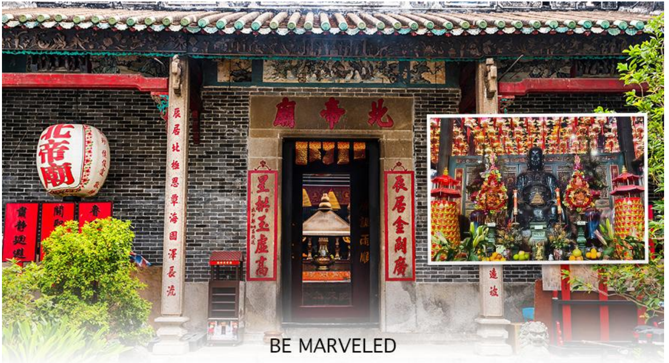
BE MARVELED วัดปักไต่

จากนั้นนำท่าน ช้อปปิ้ง ย่านจิมซาจุ่ย เป็นแหล่งช้อปปิ้งชื่อดัง มีร้านขายของทั้งเครื่องหนัง, เครื่องกีฬา, เครื่องใช้ไฟฟ้า, กล้องถ่ายรูป, อุปกรณ์อิเล็กทรอนิกส์และสินค้าแบบที่เป็นของพื้นเมืองฮ่องกงอยู่ด้วย อีกทั้งสินค้า แบรินด์เนม รวมถึงร้านอาหาร ตั้งอยู่บนถนนนาธาน ถนนทอดยาวตั้งแต่จิมซาจุ่ย จนถึงย่านปรีนซ์เอ็ดเวิร์ด เต็มไปด้วยร้านค้าต่าง ๆ มากมาย ทั้งเสื้อผ้าแบรนด์เนมระดับ HI-END ชื่อดังทั่วโลก ห้างสรรพสินค้าที่ทันสมัย จากถนน นาธานไปที่ถนนแคนตัน ท่านจะตื่นตาตื่นใจไปกับเอาต์เล็ตแบรนด์ที่เรียงติดกันเป็นแถบ นอกจากนี้ยังมี HARBOUR CITY ศูนย์การค้ายักษ์ใหญ่ของฮ่องกง ซึ่งมีร้านค้ากว่า 450 ร้านรวมอยู่ที่นี่ และมี SHOPPING COMPLEX ขนาดใหญ่ชื่อ OCEAN TERMINAL ซึ่งประกอบไปด้วยห้างสรรพสินค้า เรียงรายกันอยู่ และมีทางเชื่อม ติดต่อกันสามารถเดินทะลุถึงกันได้ มีสินค้าแบรนด์ดัง ไม่ว่าจะเป็น GIORDANO, BOSSINI, COACH, LONGCHAMP, LOUIS VUITTON, PRADA, HEMES และอีกมากมายให้ท่านได้เลือกซื้อ