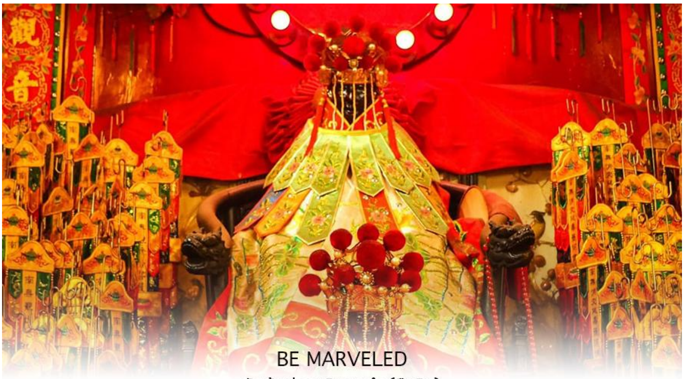
วัดเจ้าแม่กวนอิมสองอำ (ยิมวิน)

หลังจากนั้น นำทุกท่านเดินทางไปยัง (เจ้าแม่กวนอิม วัดสองอำ (HUNG HOM KWUN YUM TEMPLE) เป็นหนึ่งในวัดที่เก่าแก่ที่สุดของฮ่องกง และชาวฮ่องกงเลื่อมใสศรัทธามาก สร้างขึ้นในปี ค.ศ.1873 ในสมัยช่วงสงครามโลกครั้งที่ 2 มีการปล่อยระเบิดลงบริเวณใกล้เคียงกับวัดแห่งนี้หลายต่อหลายครั้ง ทำให้มีผู้บาดเจ็บและล้มตายมากมาย แต่ชาวบ้านที่หนีเข้าไปหลบภัยในวัดนี้กลับปลอดภัยอย่างปาฏิหาริย์ และตัววัดก็ไม่ได้ได้รับความเสียหายจากเหตุการณ์ทิ้งระเบิดที่น่าอัศจรรย์ ตามความเชื่อของคนจีนในฮ่องกง-มาเก๊า จะมี "วันเปิดทรัพย์" หรือ "พิธียืมเงิน เจ้าแม่กวนอิมฮ่องกง" เป็นวันที่จะมาขอพรและยืมเงินเจ้าแม่กวนอิมซึ่งนับจากหลังวันตรุษจีน ไป 26 วัน จะเป็นวันเปิดทรัพย์ที่จัดขึ้นในทุกๆปี พิธีนี้จะมีเพียงครั้งปีละครั้งเท่านั้น เป็นวันสำคัญอีกวันที่คนหลังไหลมาไหว้ขอพรอย่างไม่ขาดสาย