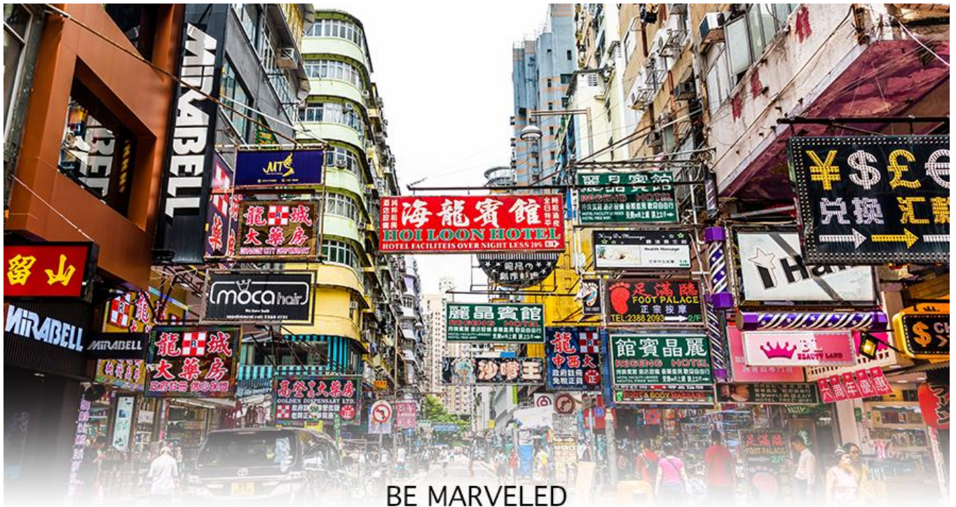
BE MARVELED MONGKOK

เครื่องสำอาง รองเท้า กระเป๋า เครื่องประดับมากมาย อีกทั้งยังมีร้านอาหาร และเครื่องดื่ม ที่ขึ้นชื่อหลากหลายชนิด ให้ทุกท่านได้ลองลิ้มรสอีกมากมาย