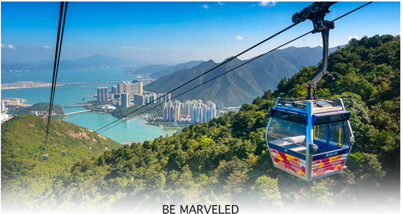
BE MARVELED กระเช้านองปิง

ล่าง ซึ่งการเดินทางขึ้นไปสักการะองค์พระใหญ่อย่างใกล้ชิดนั้น ต้องเดินขึ้นบันได จำนวน 268 ขั้นและได้รับเลือกให้เป็นสิ่งมหัศจรรย์ทางวิศวกรรมขั้นที่ 4 จากทั้งหมด 10 ชั้นของฮ่องกงในปี ค.ศ. 2000 ถือเป็นพระพุทธรูปองค์ใหญ่ที่เป็นสุดยอดของประติมากรรมทางพุทธศาสนาที่มีการผสมผสานระหว่างศิลปะสำริดแบบดั้งเดิมกับเทคโนโลยีสมัยใหม่ ชาวฮ่องกงเชื่อว่า หากใครได้มานมัสการขอพรองค์พระใหญ่แห่งนี้แล้ว ชีวิตก็จะมีแต่ความโชคดี มีความสุขสมหวัง และประสบความสำเร็จในทุกๆ ด้าน หลังจากไหว้พระแล้วท่านสามารถเลือกซื้อของฝาก, ของที่ระลึก จากหมู่บ้านนองปิง อาทิเช่น หยก ไข่มุก หรือเครื่องประดับคริสตัล เพื่อเป็นของที่ระลึก จากนั้นนั่งกระเช้ากลับลงมายังสถานีตุ่งซุง