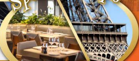
รับประทานอาหารกลางวัน บนหอไอเฟล