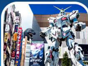
ช้อปปิ้งชินจูกุ+กันดั้มยักษ์