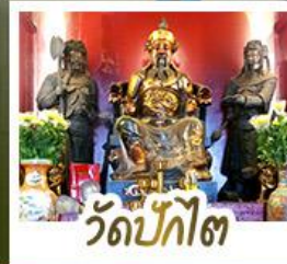
วัดปี้กโต