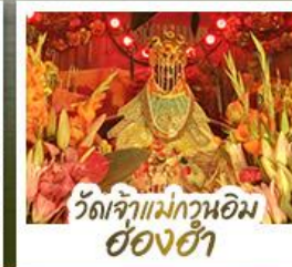
วัดเจ้าแม่กวนอิมอ่องฮ่า