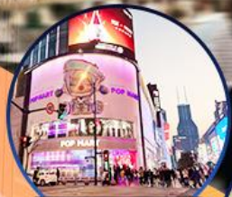
ถนนหนานจิง