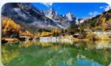
ปี้ผิงโกว