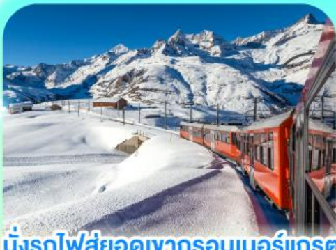
นั่งรถไฟสู่อยอดเขากรอนเนอร์เกรต