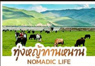
ทุ่งหญ้ากานหนาน NOMADIC LIFE