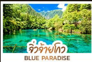
จิวจ้ายโกว BLUE PARADISE