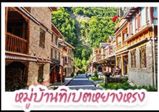
หมู่บ้านทิเบตเซี่ยงไฮ้

ตะลุยเจียงตู คูหิมะต้ากู่ปิงชาน ชมเช็กอินแพนด้ายักษ์ พักใจที่หยดน้ำดาสีฟ้า! แวะชิลเมืองโบราณลั่วใต้ สัมผัสลมตะวันตก หมู่บ้านทิเบตทางทรงฮาตือ สัมผัสความหนาวเย็นที่ อุกยานสวรรค์ธารน้ำแข็งต้ากู่ปิงชาน แหล่งรวมวิวหลักล้าน ตื่นตาไปกับแสงสียามค่ำคั่น หยดน้ำดาสีฟ้า ณ สะพานทามเอียว เมืองตูเจียงเยี่ยน ก่อนปิดท้ายด้วยการช้อปปิ้งจุใจ ถนนช้อปปิ้ง-ไถ่กุหลาบ และอะภาฟกับ แพนด้าเซลฟ์ สุดคิวท์