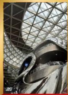
พิพิธภัณฑ์ศิลปะร่วมสมัยเซินเจิ้น