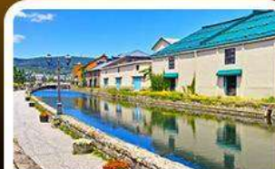
คลองไอตารุ