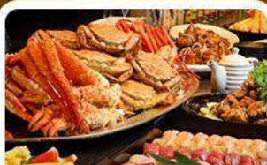
บุฟเฟ่ต์ซาซิมิ+ชาบู 3 ชนิด