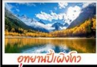
อุทยานป่าแดงโกว