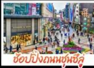
ซอยปิงกวมซุนชิว