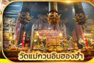
วัดแม่กวนอิมของฮ่า