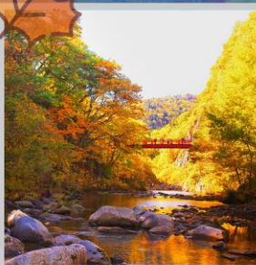
“JOZANKEI FUTAMI BRIDGE”