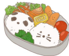
อาหารสำหรับเด็ก ( 2-11 ปี ) *วัตถุประสงค์ขึ้นอยู่กับทาว์ราน