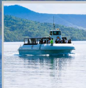
“LAKE SHIKOTSU GLASS BOAT”