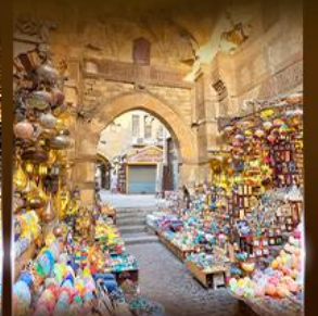
ตลาดงานเวอลาสี