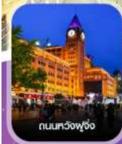
ถนนทวิงฟู่จิ่ง