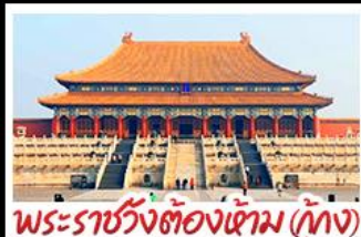
พระราชวังต้องห้าม (ปักกิ่ง)