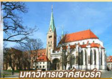
มหาวิหารอาคัสบวร์ค