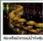
สองเรือมังกรแม่น้ำกิ่งสุ่ย