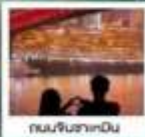
ถนนจินซาเหมิน