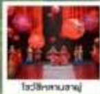
โซ่วซีหลานซาฟู่