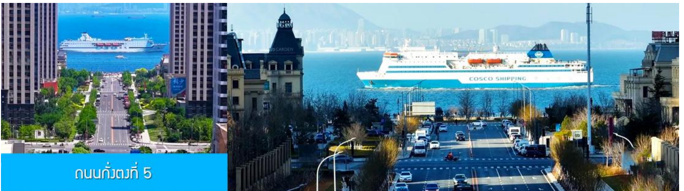
ถนนกั๋วตง 5