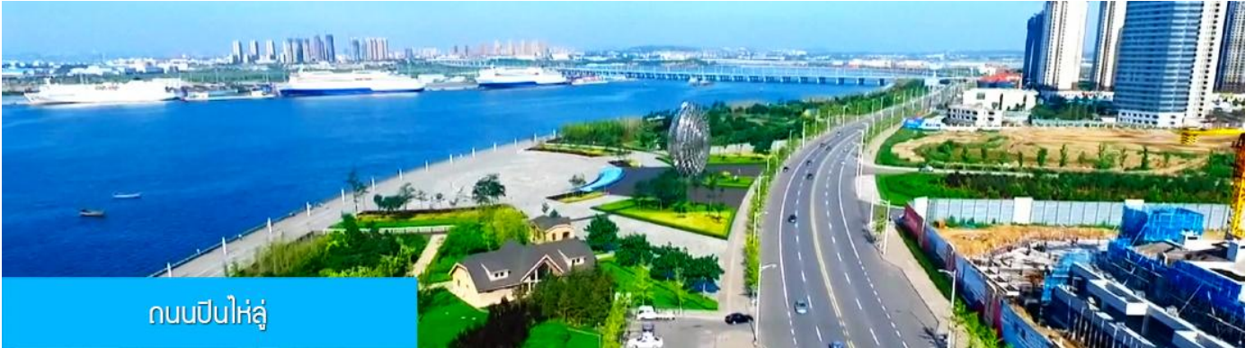
ถนนปินไห่หลู่

ล้อมด้วยตึกระฟ้าที่ทันสมัย ภายในมีบ่อน้ำพุคนตรี ลานหญ้าขนาดใหญ่ และลานกว้างสำหรับจัดกิจกรรม กลางแจ้ง อาทิ เทศกาลเบียร์นานาชาติ การแข่งขันวิ่งมาราธอน งานแฟชั่นนานาชาติเมืองต้าเหลียน ฯลฯ