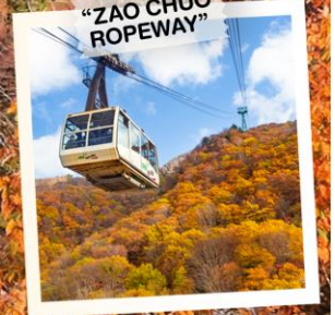
"ZAO CHUO ROPEWAY"

วันเดินทาง 30 ต.ค. - 5 พ.ย. 2569 4 - 10 พ.ย. 2569