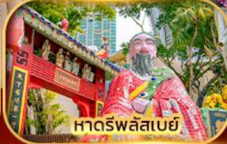
หาดรพลัสเบย์