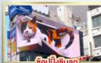
ซูปป์ชินจูกุ