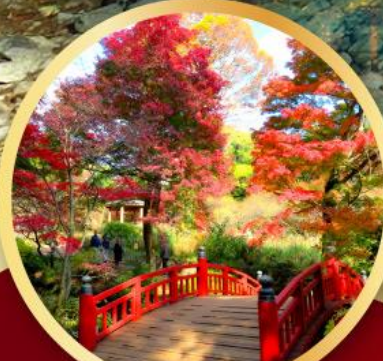
สวนดอกบ๊วยอาคาบิ