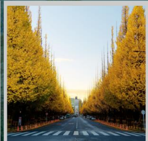
“ICHONAMIKI GINGO AVENUE”