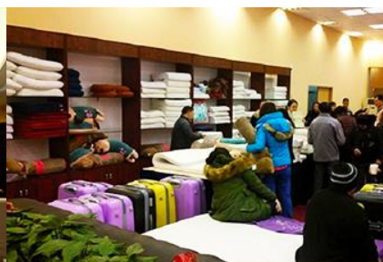
ศูนย์จำหน่ายผลิตภัณฑ์ยางพารา