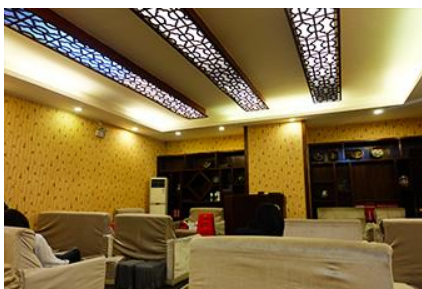
ศูนย์แพทย์แผนจีน

อัตราค่าบริการสำหรับโปรแกรมเสริมการแสดงชุด The love Story of Wooden man and Fairy Fox ท่านละ 400 หยวน (หรือประมาณ 2000.-บาทขึ้นอยู่กับอัตราแลกเปลี่ยน) ระยะเวลาที่ใช้ในการเที่ยวชมการแสดง ประมาณ 3 ชั่วโมง รวมเวลาเดินทางไปกลับค่าบริการรวม ค่าบัตรเข้าชม ค่ารถรับ ส่ง และค่าน้ำทิพย์ของไกด์ท้องถิ่น