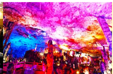
ถ้าเก้าสวรรค์วิวเทียนถั่ง

วันที่สาม เมืองจางเจียเจี๋ย-ศูนย์แพทย์แผนจีน -ศูนย์จำหน่ายผลิตภัณฑ์ยางพารา-ถ้าเก้าสวรรค์-อุทยานฟงเหลียนซี-ล่องเรือธารน้ำหมาเหียนเหอ-เมืองโบราณฝูหรงจิน