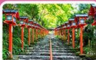
ศาลเจ้าคิฟูเนะ