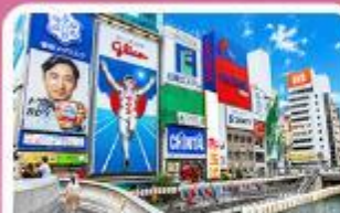
ชิบโซบาชิ