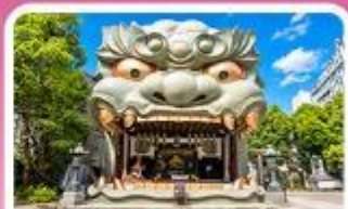
ศาลเจ้านิมมะ ยาซากะ