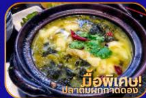
มีอพิเศษ! ปลาต้มผักกาดดอง