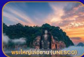
พระใหญ่เล่อซาน (UNESCO)

ล่องเรือชม "พระใหญ่เล่อซาน" - เมืองโบราณหวงหลงซี - แพนด้าเซลฟี - ห้องสมุดจงซูเก้อ - Wangjianglou Park - ถนนชุนซีลู่ (แหล่งช้อปปิ้ง) - IFS (แพนด้าปีนตึก) - วัดต้าเจ้อ