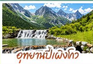
อุทยานปีติงโกว